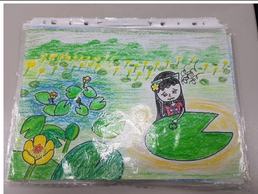
手繪作品原稿依序放入資料夾提交 (勿裝訂、打孔)