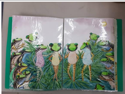
手繪作品原稿依序放入資料夾提交 (勿裝訂、打孔)