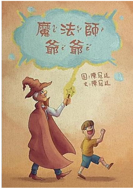
作品規格-A4 尺寸直式 (高 29.7cm×寬 21cm)