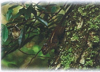
條紋松鼠