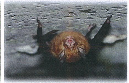
小蹄鼻蝠