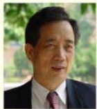
召集人 國立臺灣師範大學 黃光男 名譽教授