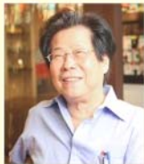
國立政治大學 創造力講座教授 吳靜吉 名譽教授