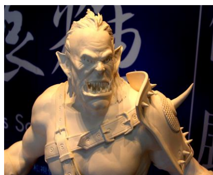
陳振輝教授創作作品