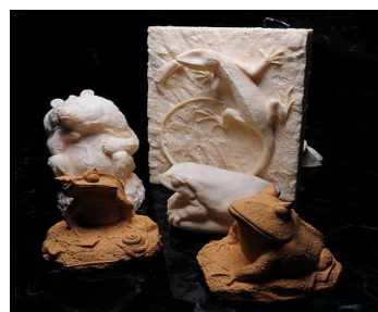
SKINK HAUN 公仔達人— 創作作品及原型